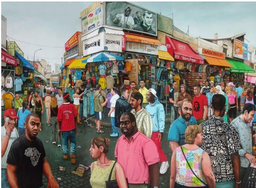
Les puces de Clignancourt, 2003, acrylic on wood, 200 x 258 cm, © Julien Beneyton

Son processus de création se déroule en plusieurs étapes. Par ses voyages et ses rencontres, il accumule de la documentation qu'il rapporte ensuite dans son atelier. Il élabore alors ses compositions comme des montages d'après ses souvenirs et ses photographies.