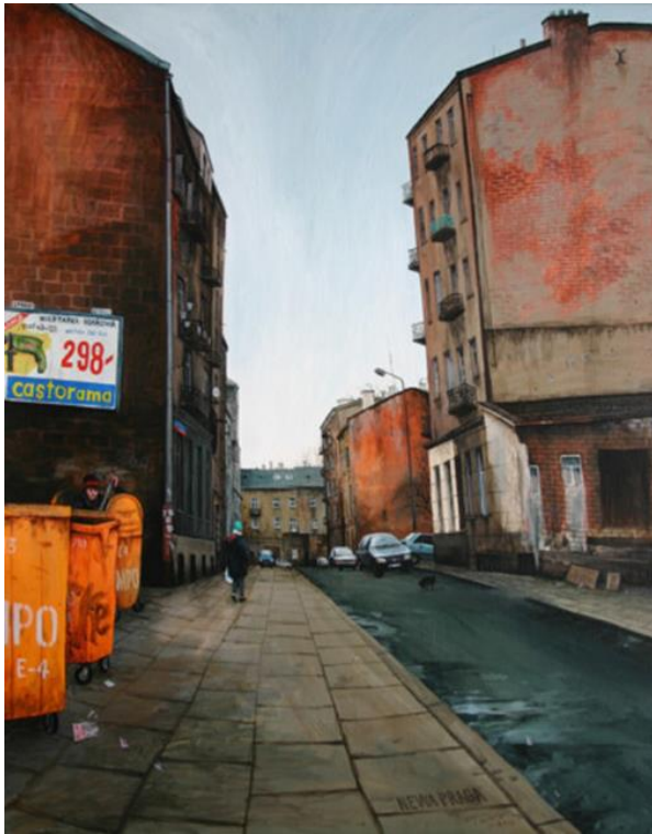
Varsovie, Newa-Praga, December morning, 2005, acrylique sur bois, 75 x 60 cm, © Julien Beneyton

Par obsession du détail, il peut passer plusieurs mois à la réalisation d'un tableau. Le style pictural et la technique de l'artiste évoluent avec les outils technologiques : polaroid, appareil photo argentique, appareil photo numérique, smartphone. Le passage de la photographie à la peinture donne à l'image un aspect pictural qui la distance du réel : couleurs trop vives, perspective déformée, proportions fausses, trace du pinceau, matérialité de la peinture... Ces éléments nous permettent de porter un regard critique et sensible sur les scènes peintes.