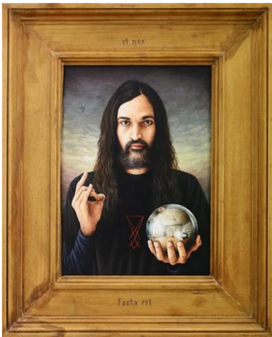
Et nox facta est , 2016, acrylic on wood and frame, 49 x 40 cm, © Julien Beneyton

Influencé par la peinture de la Renaissance flamande et italienne, l'artiste revisite, dans ses œuvres récentes, le portrait et la nature morte 1 . Avec la nature morte, il expérimente le volume en réalisant des installations composées d'objets manufacturés et de sculptures qu'il crée.