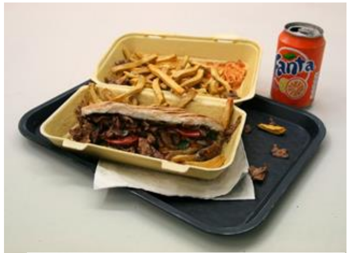
Menu Grec Frites, 2015, acrylique sur objets et argile, 34 x 36 x 8 cm, © Julien Beneyton