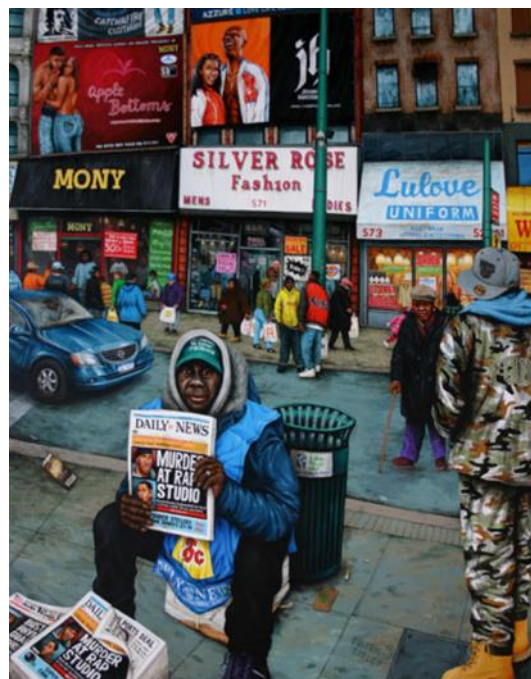
New York City J-Roc Queensbridge, 2006, acrylique sur bois, 150 x 350 cm, © Julien Beneyton