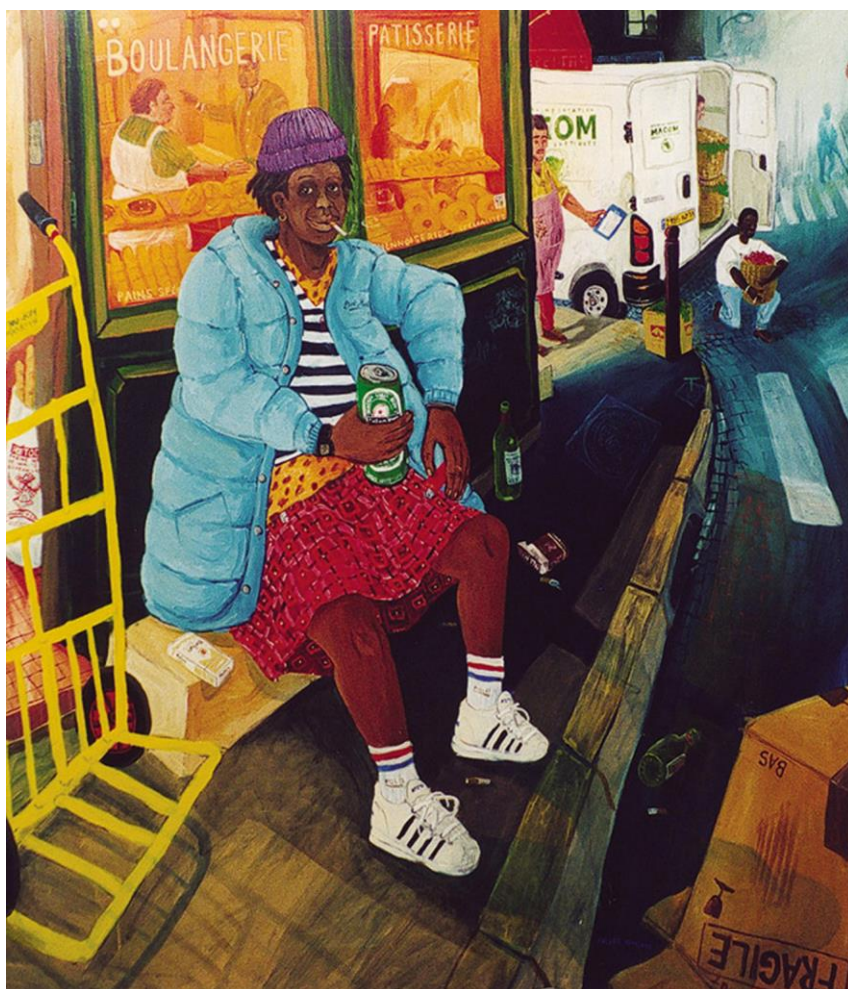
La discrète , 2000, acrylique sur bois, 160 x 142 cm, © Julien Beneyton

La contemporanéité du sujet représenté contraste ainsi avec la technique utilisée.