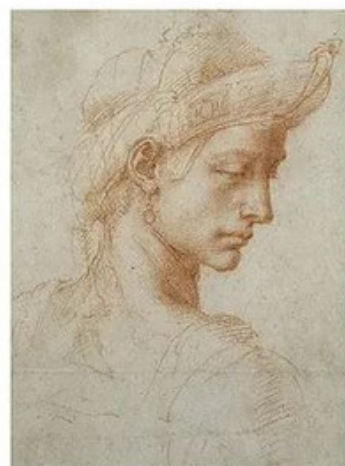
Oeuvre de Michelangelo