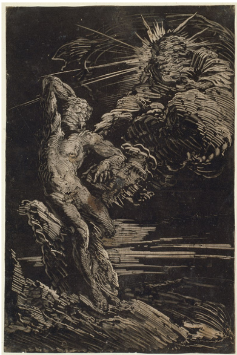
Giovanni Benedetto Castiglione, La Création d'Adam (vers 1642), monotype, Art Institute of Chicago.

Le monotype, en estampe, est un procédé d'impression sans gravure qui produit un tirage unique. Cette technique utilise l'encre typographique, la peinture à l'huile ou encore la gouache et un support non poreux comme du verre, du métal ou du plexiglas. Il existe différentes manières de réaliser des monotypes, qui utilisent les mêmes outils.