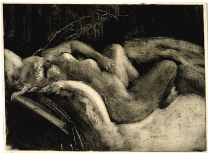
Edgar Degas, Le Sommeil (1883-1885), monotype, Londres, British Museum