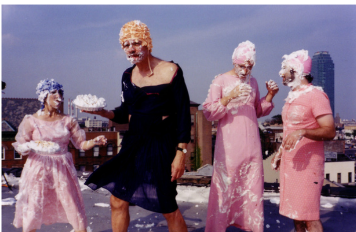
Eat My Make-up! film 6', 2005

L'étrange et le théâtral se côtoient dans son univers coloré.