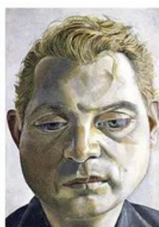
Oeuvre de Francis Bacon