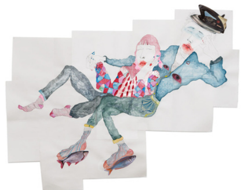
Elise et Leo au grand galop!, 2023 aquarelle et crayon sur papier aquarelle et collage 97 x 120 cm