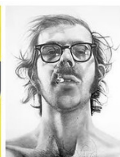
Oeuvre de Chuck Close