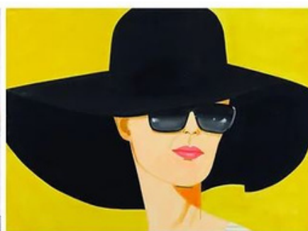
Oeuvre d'Alex Katz