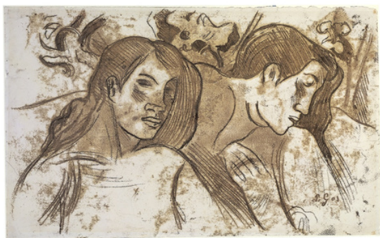
Paul Gauguin , Two Marquesans , monotype 1902