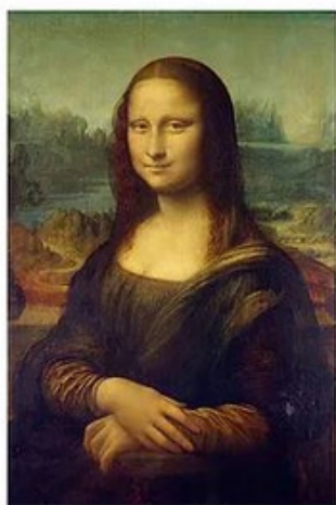
Oeuvre de Léonard De Vinci

Le portrait suit un chemin tortueux dans l'histoire de l'art. Il est le reflet exact de l'expression de la société et de son évolution. Les éléments centraux du portrait sont le visage et son expression. À travers leurs œuvres, les artistes mettent en évidence la personnalité ou encore l'état d'âme de leurs modèles.