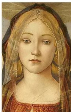
Oeuvre de Sandro Botticelli