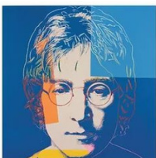
Oeuvre d'Andy Warhol