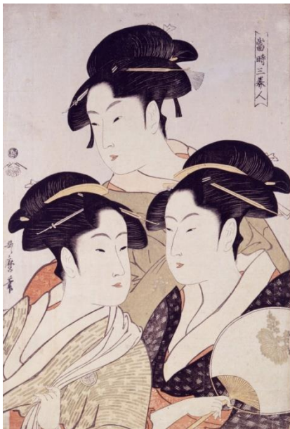
Kitagawa Utamaro, Trois beautés de notre temps , vers 1793

L'ukiyo-e est un mouvement artistique japonais de l'époque Edo (1603-1868) regroupant la pratique d'une peinture narrative populaire et la technique des estampes gravées sur bois. Les thèmes de prédilection de l'ukiyo-e correspondent aux centres d'intérêts d'une bourgeoisie urbaine et marchande émergente : de belles femmes (souvent des courtisanes), des scènes érotiques, des scènes de la vie quotidienne, des lutteurs de sumo, des créatures fantastiques etc. La technique de l'estampe permet des reproductions sur papier peu coûteuses, qui rendent les œuvres abordables.