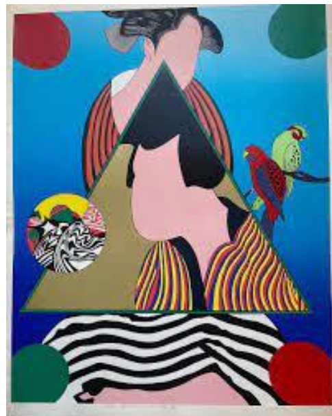
Go Yayanagi, Edo Games , Sérigraphie, 37.5 x 29.5ed. 25, © Go Yayanagi