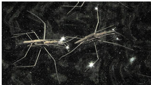
Capture video, Gerridae , 2020, vidéo HD couleur, musique de Voiski, 4'11", © Anne-Charlotte Finel, ADAGP Paris 2021

Anne-charlotte Finel mène aussi une réflexion sur les bêtes mal aimées comme les araignées d'eau ( Gerridae , 2020) ou les serpents. Elle a travaillé ces dernières années sur la question des extrêmes allant du très grand paysage à des échelles bien plus microscopiques. Elle revient toujours à la question de l'animal ainsi depuis 2015 avec Chien et loup ou Molosse en 2016.