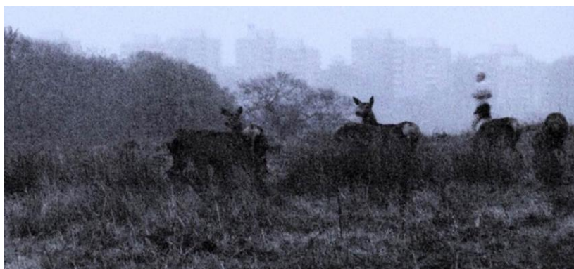
Capture vidéo ENTRE CHIEN ET LOUP / musique de Luc Kheradmand / 2015 / HD / couleur / 5'44".

Elle a ainsi filmé des chutes d'eau, transformant leur mouvement vertical en une image hypnotique. Son intérêt reste vivace également pour la question de la perte des repères – elle a de cette manière suivi des chiens blancs, devenant de simples lueurs dans l'obscurité naissante du soir. Dans les deux cas, l'artiste, qui crée toujours à partir d'une vision où une image fugitive, nous pousse à imaginer des mondes cachés – car « l'obscurité permet de mieux voir » 1 .