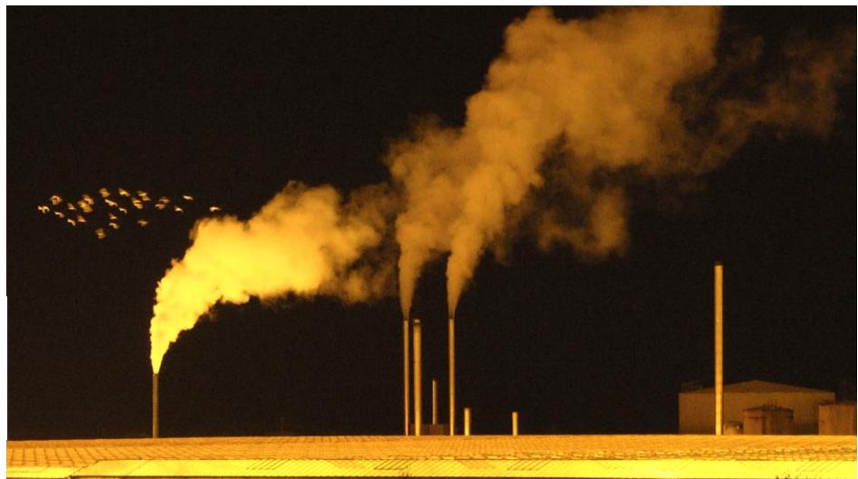
Capture vidéo, Hors-sol , 2020, vidéo HD, musique de Voiski, 10'23', © Anne-Charlotte Finel