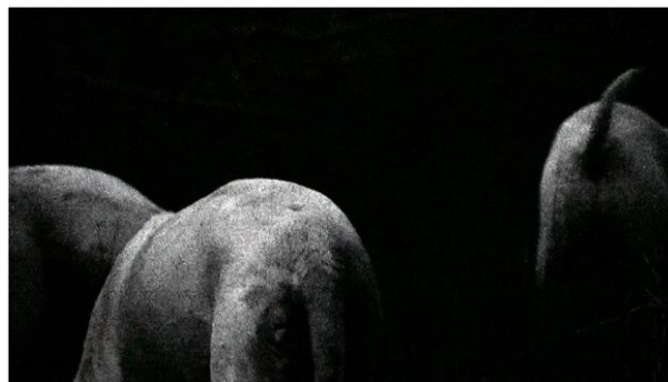
Capture video, Molosses / 2016 / vidéo HD / 2'23" / sans son, © Anne-Charlotte Finel, ADAGP Paris 2021