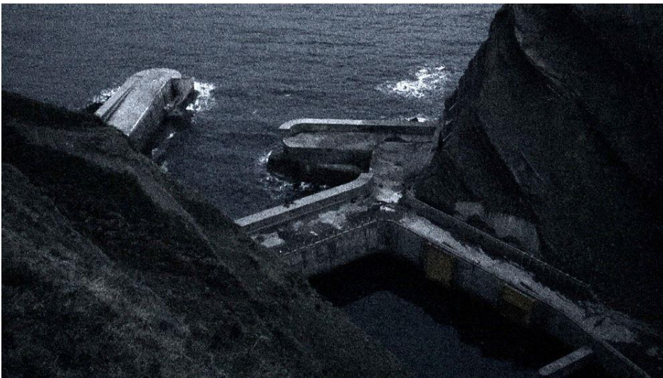
Capture vidéo Ronde de nuit / collaboration avec Marie Sommer / musique de Luc Kheradmand / 2016 / HD / couleur / 5'17"

Ces images sont saisies dans les intervalles où le temps paraît suspendu, où tout peut se produire. Anne-charlotte Finel cherche à s'éloigner d'une réalité qui serait trop crue, trop définie. Ses vidéos donnent à voir des images lentes, quasi oniriques, semblables à un motif abstrait.