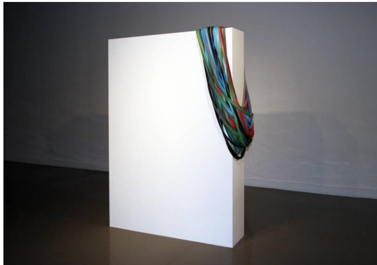
Chloé Dugit-Gros, Fils conducteurs , 2008, Installation : bois et caoutchouc, 190 x 32 x 134 cm

Fils conducteurs illustre l'exploration par Chloé Dugit-Gros du passage du dessin au volume en tant qu' espace narratif . Conçu comme un agrandissement d'une feuille de dessin, il donne l'impression que les lignes colorées se sont échappées de la feuille pour se rassembler sur son flanc. Cette pièce reflète les interrogations de l'artiste sur la circulation des images à