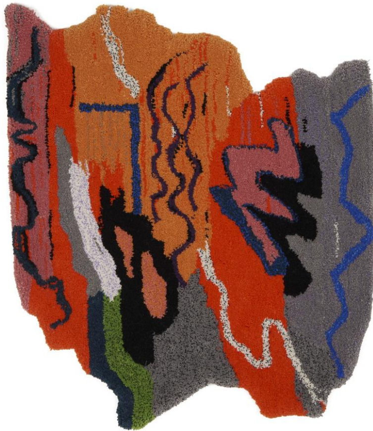
Chloé Dugit-Gros, What kind of color do you like to eat ? , 2020, Œuvre textile : tapis en laine tuftée collée sur panneau de mdf, 87 x 72 x 4 cm, Fonds d'art contemporain - Paris Collections © Adagp, Paris 2024

Chloé Dugit-Gros a réalisé What kind of color do you like to eat ? lors d'une résidence artistique aux Ateliers des Arques en 2019, où elle découvre la technique du tufting 1 .