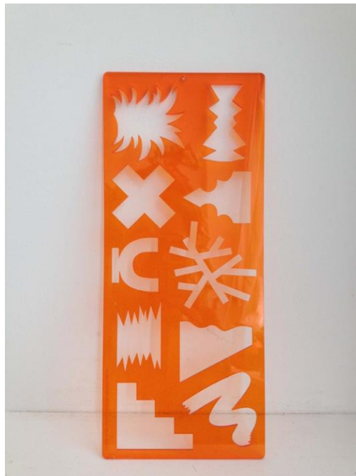
Chloé Dugit-Gros, Normographe , édition Nopoto 2015, Sculpture : plexiglas © Chloé Dugit-Gros

Le travail de Chloé Dugit-Gros peut être caractérisé par une exploration de la forme sous toutes ses facettes. Que cela soit dans le dessin, la sculpture, la tapisserie ou l'installation, l'artiste déploie un langage visuel riche et varié, où les formes élémentaires se transforment et interagissent.