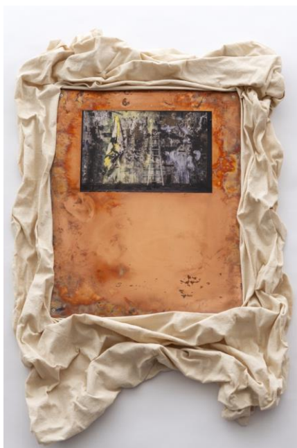
Radouan Zeghidour, Evasion , série Evasion , 2018, Sculpture : impression numérique par oxydation sur cuivre, coton, cire, bois, colle à bois, 80 x 60 x 12 cm, Fonds d'art contemporain – Paris Collections © Adagp, Paris 2024

Evasion révèle les espaces cachés et interdits de la ville à travers des photographies encadrées de lieux souterrains, encerclées de tissus cirés, qui invitent à une exploration poétique des marges urbaines . Chloé Dugit-Gros et Radouan Zeghidour partagent ainsi une fascination pour les interstices urbains. Leurs œuvres révèlent une sensibilité commune à l'égard des zones urbaines méconnues et des marges de la société, offrant des perspectives uniques sur la complexité de la vie citadine. Ils explorent tous.tes deux les limites et les frontières de l'environnement urbain, invitant les publics à repenser sa relation avec la ville et ses espaces cachés.