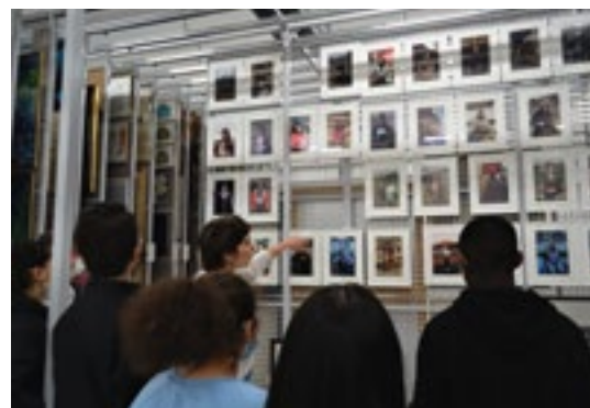
Visite des réserves du Fonds d'art contemporain, mars 2022