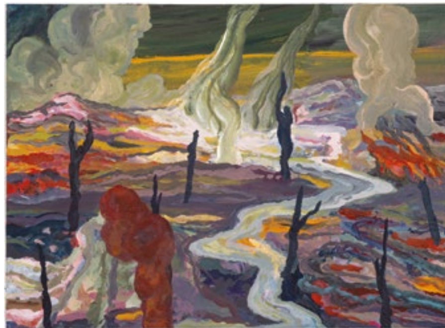
Sans titre, Monde intermédiaire , série Nouvelles fictions , 2015 – 2017 Peinture acrylique sur papier 20,5 x 15 cm