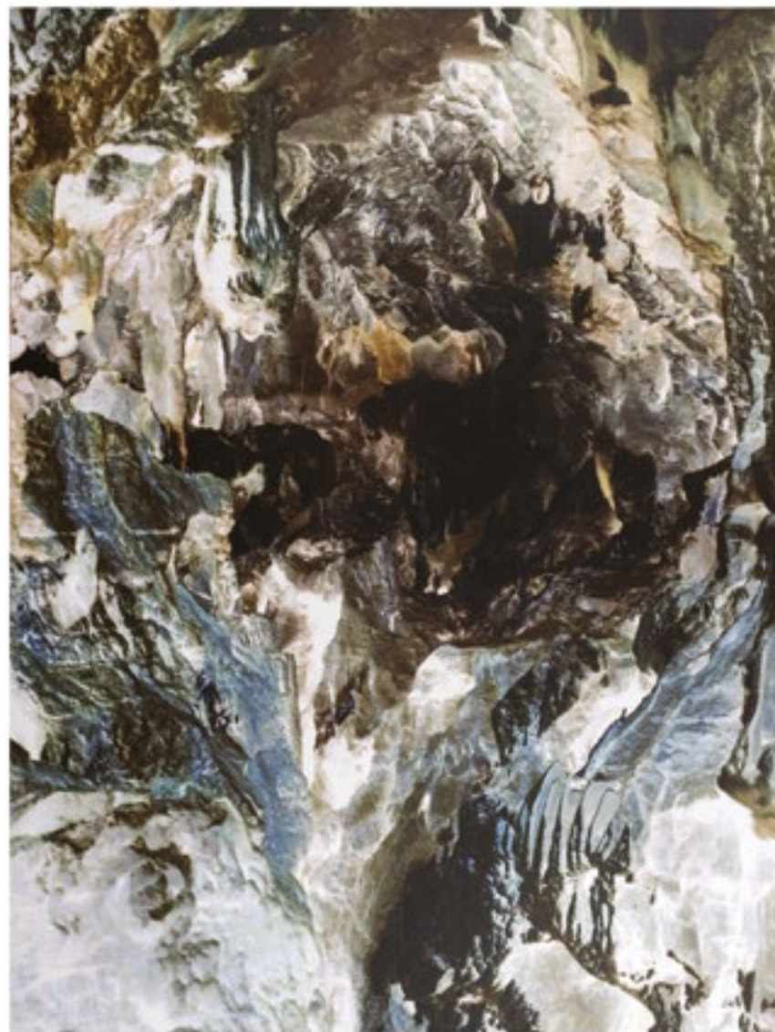
Hu2 #13, 2021 Série Hu2 Impression sur Dibond 60 x 45 cm, édition 1/2 + 1 EA

Portrait : Hadrien Reyre Œuvre : Hélène Mauri, © Adagp, Paris, 2023