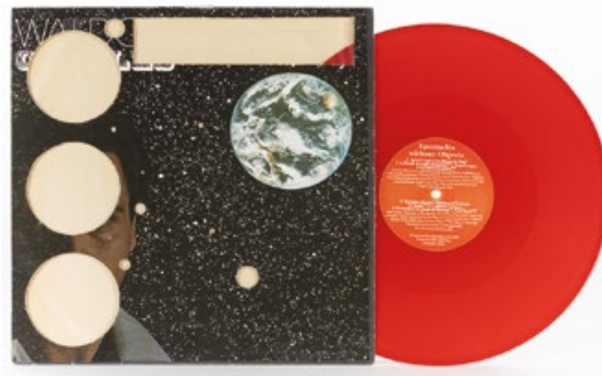
Spectacles sans objet (vinyle), 2016 Enregistrements sonores sous forme de vinyle et pochette vinyle 15 min 22 et 31,5 x 31,5 cm (pochette), édition 11/20

Portrait : Lucas Charrier Œuvre : Hélène Mauri, © Adagp, Paris, 202