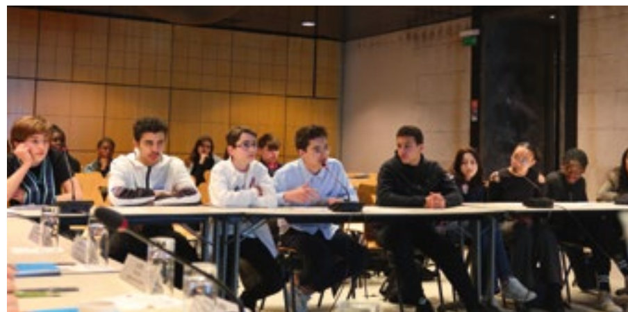
Commission Jeunes Collectionneurs , avril 2023