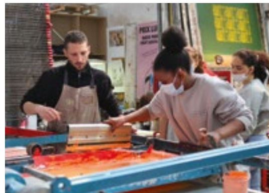
Atelier sérigraphie à la Villa Belleville, avril 2022