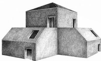
Maison noire 10, 2008