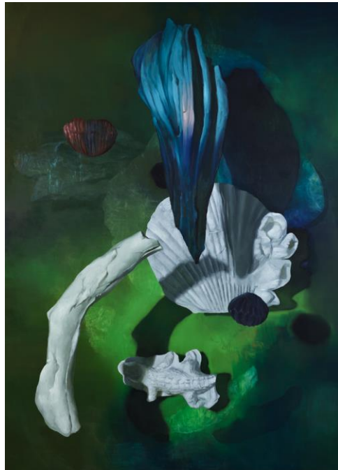
Maude Maris, Red Heart , 2018

Maude Maris peint ainsi subtilement différents matériaux et matières, minéraux, végétaux, lisses, irréguliers, tortueux, dont l'aspect est conservé par le travail de moulage préalable à ses peintures. Ces objets divers sont ainsi unifiés par cette première phase du moulage en plâtre, puis par la prise photographique intermédiaire de ces formes mises en scènes, et enfin par la peinture finale de l'image. Trois espaces sont ainsi condensés dans ses peintures : espace physique, espace photographique, espace pictural. Par ce processus les objets utilisés sont ainsi dépossédés de leur utilité quotidienne et mettent en valeur leurs qualités esthétiques par leur mise en scène et assemblage via ces étapes du protocole de la création artistique de Maude Maris. Cette dépossession de l'utilité première des objets de permet aux spectateur.rice.s face à l'œuvre de leur conférer une nouvelle évocation ou une nouvelle histoire.