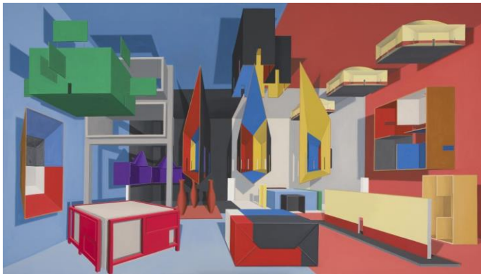
Thomas Huber, Bildraume , 2013, Collection Frac Languedoc Rousselot © Adagp, Paris, 2021

Maude Maris évoque également ses influences par ses contemporain.e.s. Elle évoque des artistes qui travaillent également sur la notion d'espace et de sculpturalité dans la peinture ou la photographie. Vous trouverez ci-dessous les travaux d'artistes contemporain.e.s