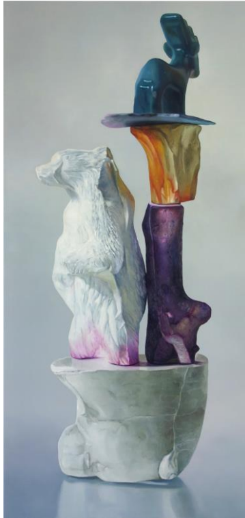
Maude MARIS Sylvestre 2020 Huile sur toile 190 x 90 cm Acquisition 2021 du Fonds d'art contemporain – Paris Collections

La palette de l'artiste se caractérise par des nuances pastel presque pâtisseries dans le début de ses peintures. Puis, sa gamme chromatique s'intensifie, elle n'hésite pas à faire usage de rouges et de jaunes jamais convoqués jusqu'alors, et fait exploser les tons froids : du bleu saphir ou pourpre pâle, du vert gazon au vert malachite.