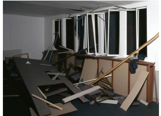
Thomas Demand, Room , 1994.