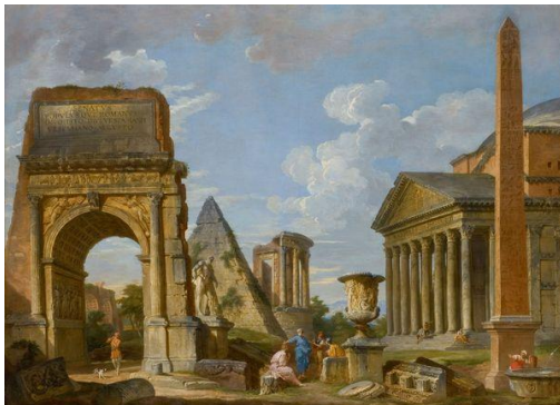
PANNINI Giovanni Paolo (Piacenza, Vers 1691 – Rome, 1765), Ruines antiques, 1733. Musée fabre

« La peinture de ruine est en apparence un contresens artistique, puisque elle met en évidence le caractère éphémère du travail humain et le triomphe final de la nature sur les prétentions des artistes à esthétiser le monde. » 1