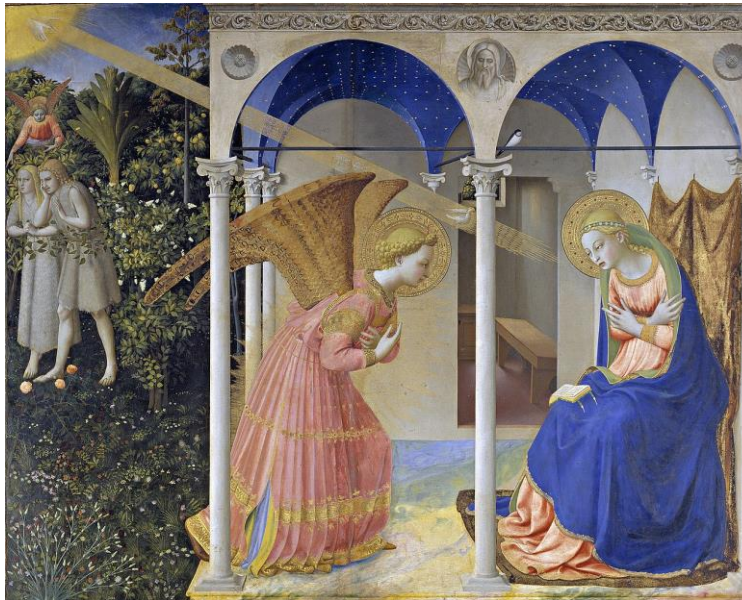
Fra Angelico, L'Annonciation et Adam et Eve chassés du Paradis , v. 1425-1426, tempera et or sur bois, 190,3 x 191,5 cm, Musée National du Prado, Madrid.