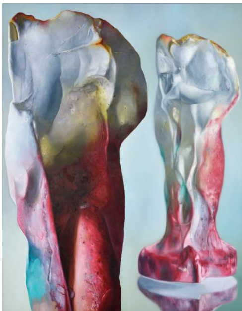
Maude Maris, Altier , 2020

La palette de l'artiste se caractérise par des nuances pastel presque pâtisseries dans le début de ses peintures. Puis, sa gamme chromatique s'intensifie, elle n'hésite pas à faire usage de rouges et de jaunes jamais convoqués jusqu'alors, et fait exploser les tons froids : du bleu saphir ou pourpre pâle, du vert gazon au vert malachite.