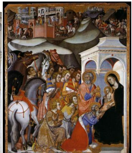
Bartolo di Fredi. L'Adoration des Mages (1385-88) Tempera sur bois, 195 × 163 cm, Pinacoteca Nazionale, Sienne

Dans ses premières séries l'artiste représentait des éléments architecturaux, murs ou parois, rappelant cette peinture de la Renaissance italienne. Aujourd'hui le tableau en lui-même définit les limites de l'espace représenté qui semble se situer entre l'atelier, la réserve, l'entrepôt contenant objets, éléments architecturaux, vestiges... Ses peintures sont des paysages/natures mortes architecturales à l'échelle non définie. Ces représentations d'espaces clos, de travail et de présentation, mais aussi les correspondances constamment entretenues entre les peintures et les sculptures, ne sont pas sans rappeler le travail de Thomas Huber.