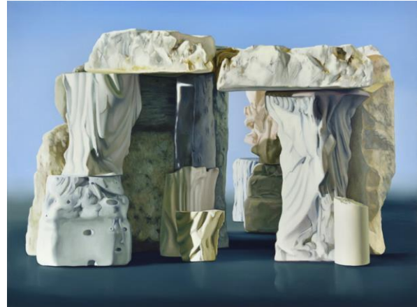
Maude Maris, Antique , 2016, ©Rebecca Fanuele

Les œuvres de Maude Maris sont empreintes de références au monde antique. Grande férue d'archéologie, l'artiste se documente sur des sites de fouilles s'inspirer des formes. Ainsi, sculptures antiques et temples jonchent son œuvre et c'est alors tout l'imaginaire de l'antiquité qui alors imprègne dans les œuvres de Maude Maris.