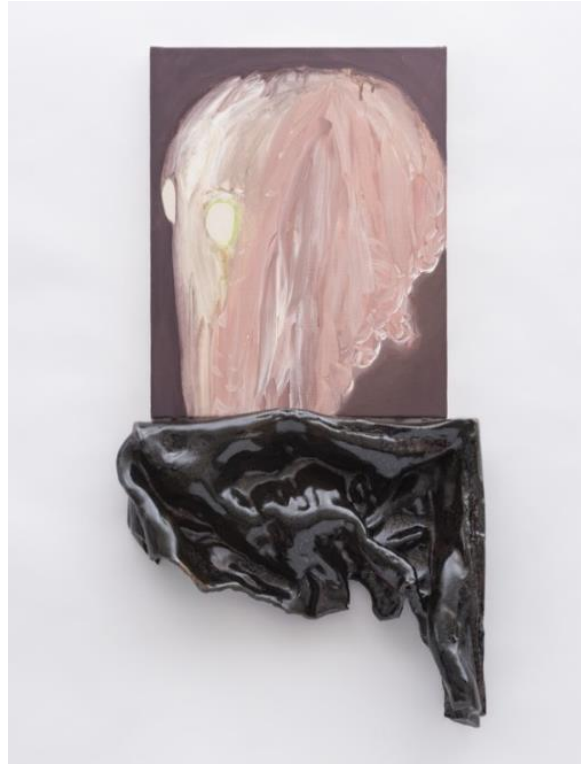
Cécile Noguès, Can we elevate an object to fall ? 2 , 2020, Installation : céramique de grès émaillé, gouache sur toile, 75 x 40 x 10 cm, Fonds d'art contemporain – Paris Collections © Adagp, Paris 2024

Cécile Noguès pratique la céramique comme un médium privilégié dont elle renouvelle l'usage et la forme avec une grande liberté. D'une esthétique chargée de protubérances et de cavités, l'apparente abstraction de l'œuvre laisse entrevoir des fragments d'objets identifiables. On arriverait presque à deviner le profil d'un visage aux yeux ronds et lumineux dans la partie picturale de son installation. L'artiste aborde la sculpture dans ses objets rudimentaires, notamment en pratiquant le modelage et le recouvrement pictural par l'émail.