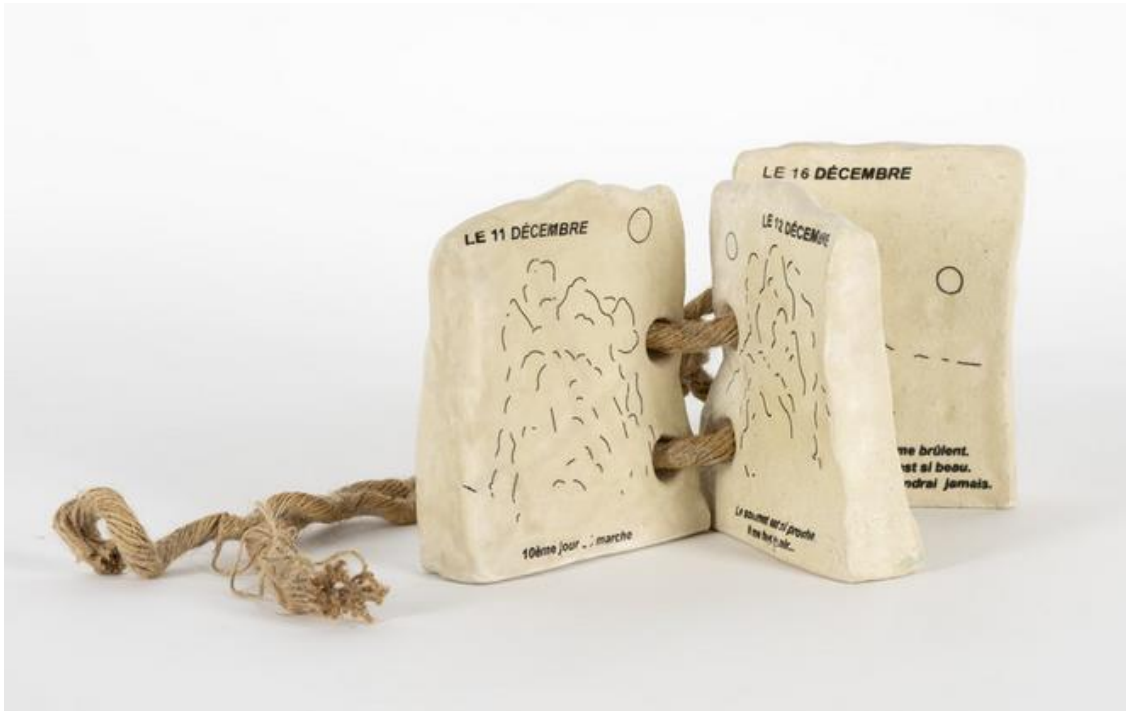
Sammy Stein et Séverine Bascouert, Du 11 au 16 décembre , de la série Les Livres-Pierres , 2021, sculpture : livre en céramique émaillé et sérigraphié, relié par une corde en chanvre, 14 x 26 x 12 cm, acquisition en 2023, Fonds d'art contemporain – Paris Collections © Sammy Stein et Séverine Bascouert, crédit photographique : Hélène Mauri