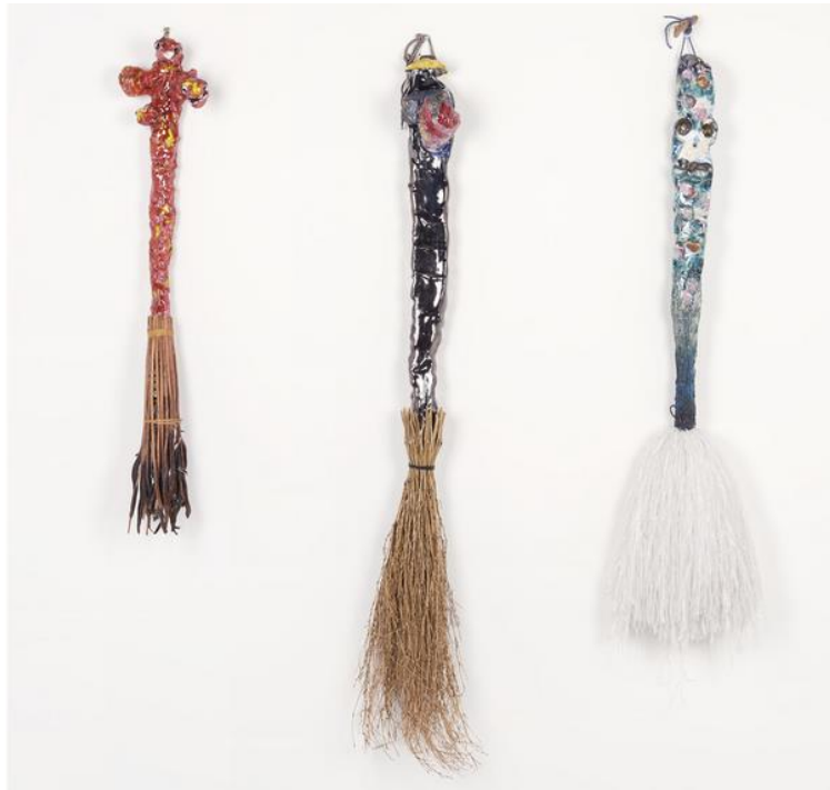
Sylvie Auvray, Sans titre de la série Balais , 2020, sculpture : céramique émaillée, bois, carton, ruban, osier, 80 x 15 x 10 cm, 110 x 10 x 13 cm, 93 x 2 x 5 cm, acquisitions en 2021, Fonds d'art contemporain – Paris Collections © Sylvie Auvray

Sylvie Auvray a étudié à l'École supérieure des beaux-arts de Montpellier et à la City and Guilds of London Art School. Au début de sa carrière, elle se définissait comme peintre, travaillant en parallèle dans la mode. Peu à peu des objets d'atelier – figurines, masques, bijoux et outils – se sont introduits dans ses expositions. Elle développe sa pratique autour d'une expérimentation foisonnante des propriétés des matériaux et de leurs usages, faisant allègrement des allers-retours de la sculpture à l'objet usuel.