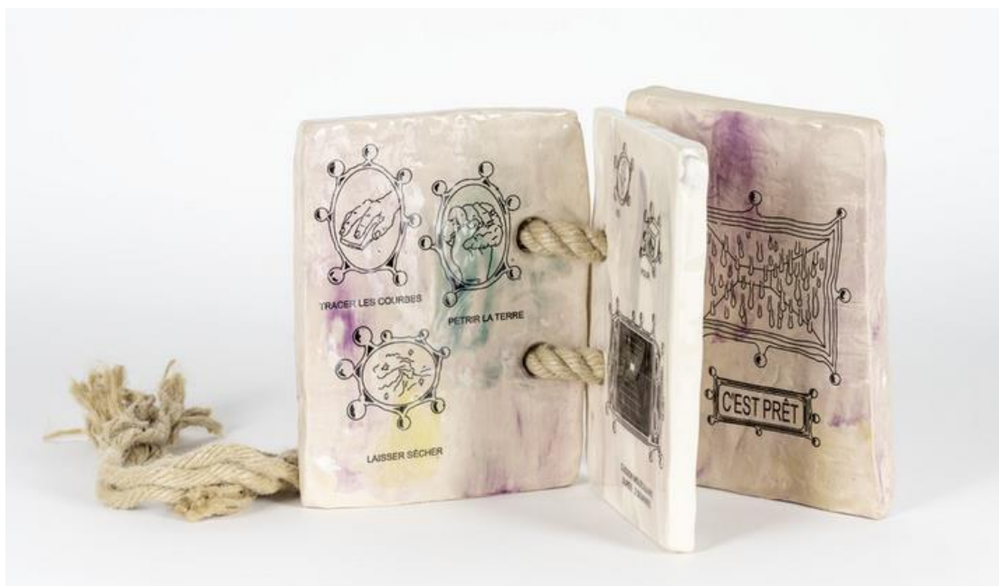
Sammy Stein et Séverine Bascouert, La Coupe triste de la série Les Livres-Pierres , 2022, sculpture : livre en céramique émaillé et sérigraphié, relié par une corde en chanvre, 20 x 15 x 2 cm, acquisition en 2023, Fonds d'art contemporain – Paris Collections © Sammy Stein et Séverine Bascouert