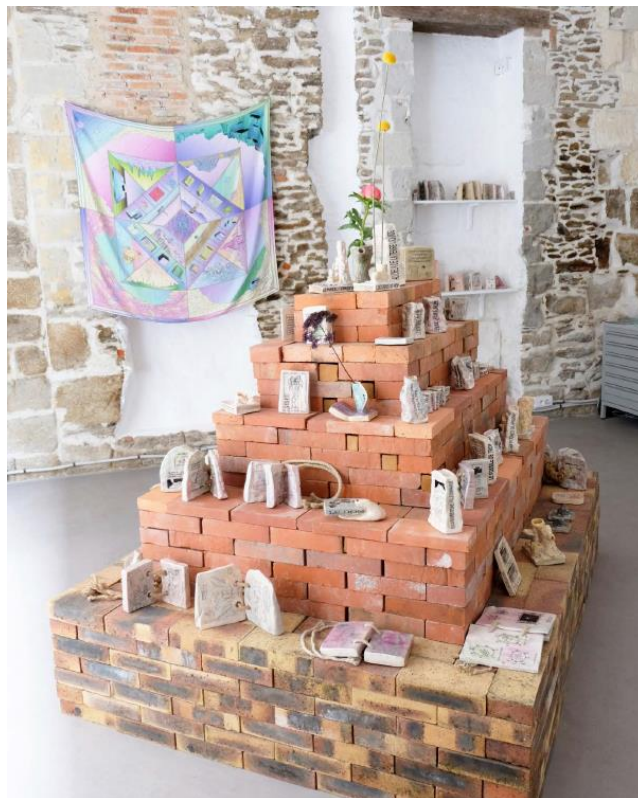
Vue de l'exposition « La Nuit des Livres-Pierres », 2022, Espace Mira, Nantes, © Sammy Stein et Séverine Bascouert / Crédits photographiques : space Mira, Nicolas Frühauf

La genèse de ces sculptures débute par une résidence artistique que Sammy Stein et Séverine Bascouert réalisent à la Villa Belleville (Paris 20 e ) gérée par l'association Cury Vavart 7 en 2021. L'année suivante, tou.tes deux ont été reçu.es pour une autre résidence sur l'île de Nantes, invité.es par l'espace MIRA à travailler dans un atelier au Pôle des Arts La Joliverie. C'est au cours de ces trois semaines que le duo d'artistes crée des pièces en céramique 8 qui seront exposées à « La Nuit des Livres-Pierres » (du 6 mai 2022 au 25 juin 2022). Cette exposition a permis de produire également une nouvelle série de sérigraphies, de livres, de revues, de fanzines et un foulard édité pour l'occasion.