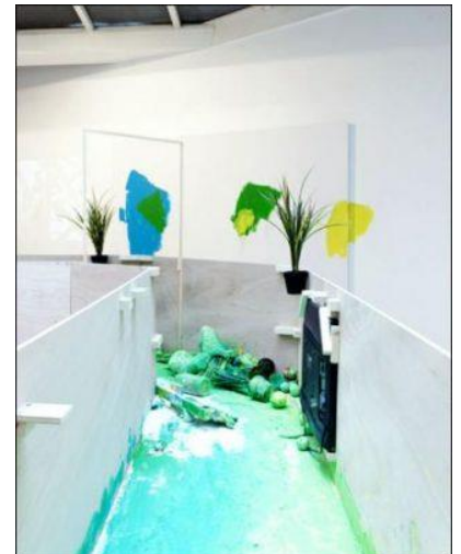
Cheese (détail), 2013. Bois, Peinture, éléments divers, vidéo, 178, 5 x 400 x 400 cm

Taro Izumi présente aussi des performances plus humoristiques et loufoques, où l'artiste se malmène parfois. La pièce Cheese par exemple, constitue un étroit parcours circulaire fait de planches de bois que Taro Izumi aura arpenté par trois fois. Des écrans de télévision rendent compte de la performance de l'artiste: on le voit laborieusement ramper, et recevoir sur le coin du nez pots de peinture ou pots de colle. Imperturbable, il continue son chemin, avec un calme olympien. Taro Izumi ne manque pas d'autodérision.