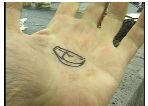
Extraits de la vidéo Napoléon de Taro Izumi