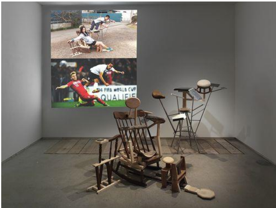
Taro Izumi, Tickled in a dream... maybe? (Fishing) , 2014. Wood, iron and video, variable dimensions. © Taro Izumi. Collection of M+ Museum for Visual Culture, Hong Kong.

Les installations qu'il construit à partir de ces hypothèses ludiques souvent absurdes, deviennent des formes inattendues, extraordinaires, et qui déjouent avec humour nos