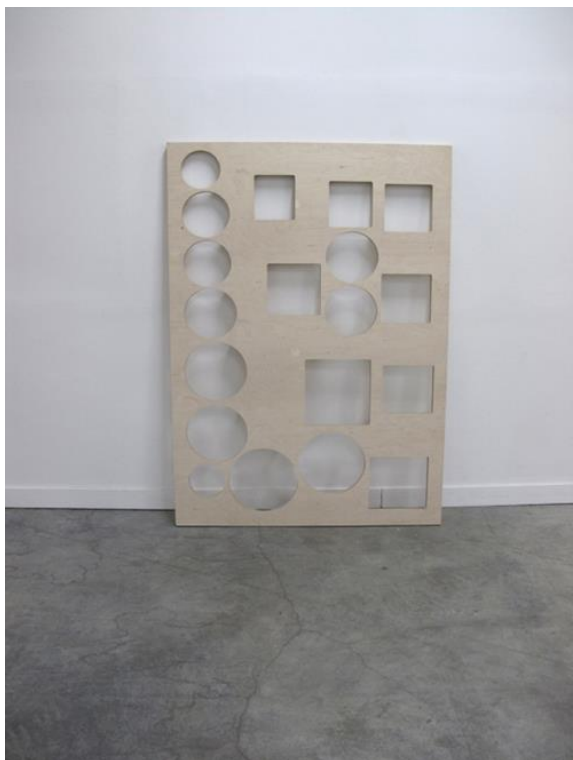
Déduction de Sharp, 2008, contreplaqué de bouleau plaqué chêne, 172 x 125 x 3 cm, © Julien Vidal, Fonds d'art contemporain – Paris Collections