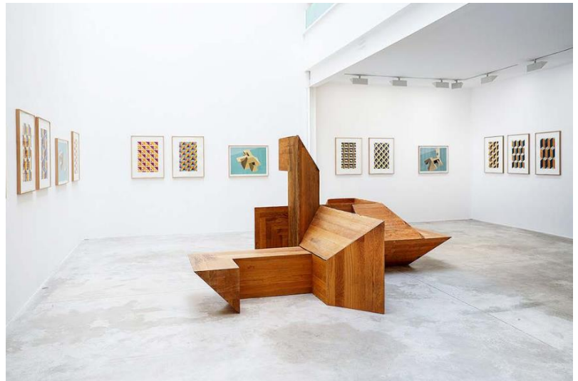
Monte Oliveto, Paris, © Courtesy Gallery Michel Rein

En s'intéressant aux volumes géométriques recensés par le mathématicien allemand Arthur Moritz Schoenflies (1853-1928), Raphaël Zarka fait réaliser plusieurs exemplaires en bois et en acier corten, du module 329. Il s'agit d'une sorte de U à bords biseautés. Ces modules sont ensuite assemblés de différentes manières pour réaliser plusieurs sculptures aux contours variés sur lesquelles l'artiste invite les skateurs à exercer leur pratique. Ces formes s'apparentent alors aux modules que l'on retrouve dans les véritables skateparks, tout en faisant clairement référence à la sculpture moderniste en acier.