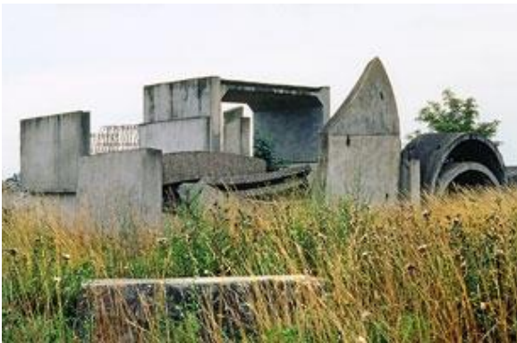
Raphaël Zarka, Les formes du repos n°11 , 2001. Tirage lightjet, 70 x 100 cm. Collection Fonds national d'art contemporain. © Courtesy de l'artiste et galerie Michel Rein, Paris.

Ses premières œuvres sont des photographies intitulées les Formes du repos, réalisées entre 2001 et 2011. Il a photographié des objets en béton délaissés et des bâtiments inachevés ou désaffectés dans des paysages en friches. Le regard de Raphaël Zarka est attiré par les formes dynamiques, celles qui suggèrent un mouvement, qui invitent le corps à mille acrobaties.