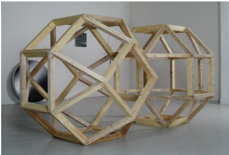
Rhombicuboctaèdres (Réplique n°1), bois brut, 145x145x290cm, 2007, © François Taverner et Marc Dieulangard. vue de l'exposition à la galerie de l'école des beaux arts de Nantes, Paris.