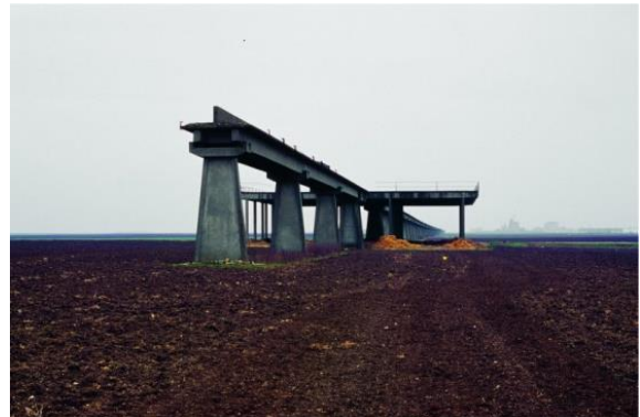
Raphaël Zarka, Les formes du repos n°3 , 2001. Tirage lightjet, 70 x 100 cm. Collection Fonds national d'art contemporain.