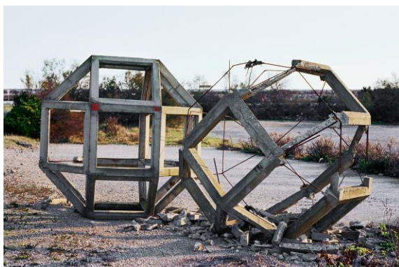
Raphaël Zarka, Les formes du repos n°1 , 2001. Tirage lightjet, 70 x 100 cm. Collection Fonds national d'art contemporain.