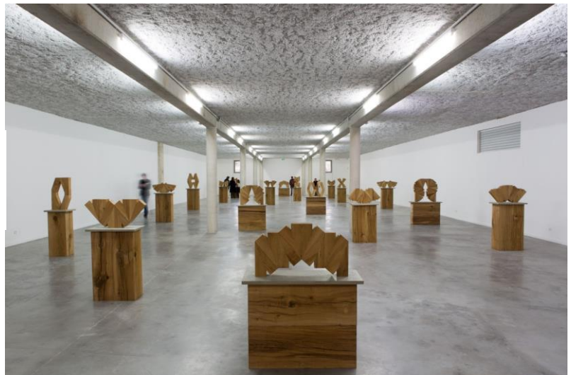
Série Prismatiques , Vue de l'exposition de « Raphaël Zarka », Musée régional d'art contemporain Languedoc – Roussillon, Sérignan, 2013 – 2014

Dans ses sculptures regroupées sous le titre de Prismatiques, Raphaël Zarka, joue avec la forme de la clé du châssis. Il s'agit d'un élément en bois insérées dans les angles du châssis. Ces petites clés permettent d'ajuster la tension de la toile. L'artiste l'utilise comme un module, qui lui permet de créer d'infinies combinaisons. « Le point de départ de la Forme à clé est un petit bricolage constitué de 36 clés de châssis assemblées pour