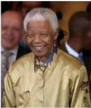
Nelson Mandela a été président de l'Afrique du Sud de 1994 à 1999.