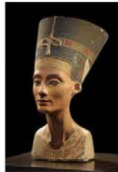
Néfertiti a été reine d'Égypte, aux côtés de son époux Akhenaton