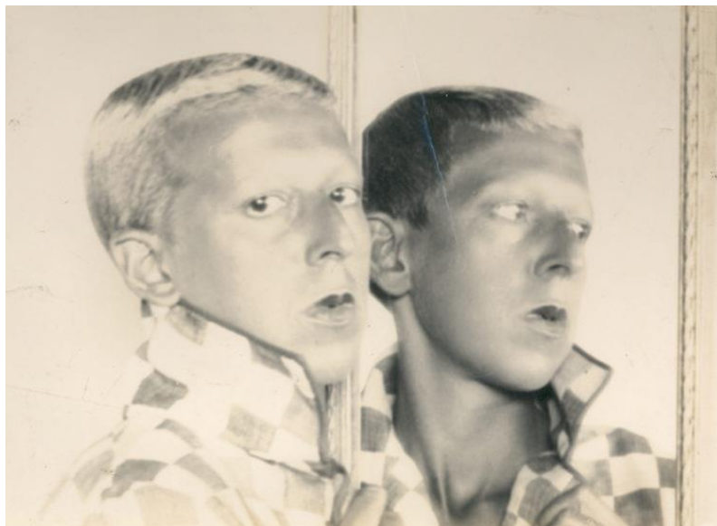
Claude Cahun, Autoportrait (reflété au miroir) , 1928, photographie, 18 x 24 cm, Jersey Heritage Trust