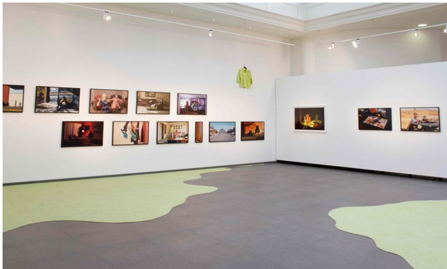
Vue de l'exposition Beyond the Shadows , Galerie La Forest Divonne, Bruxelles, 2020, © Elsa & Johanna

L'accrochage est toujours soigneusement choisi par les artistes. Parfois, elles exposent les photographies sous forme de grille, comme c'est le cas au collège, et d'autres fois, de manière dispersées dans l'espace.