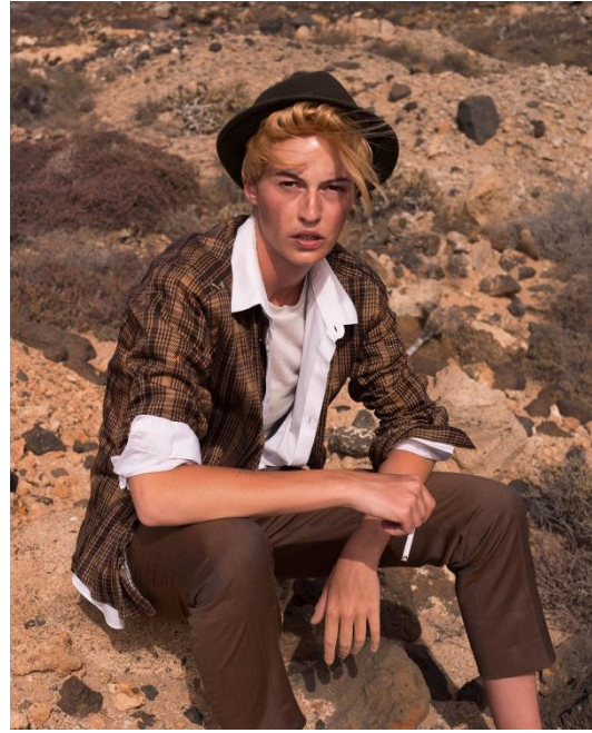
Photographies de la série Los Ojos Vendados , Iles Canaries, 2017

Pour chaque entité, elles trouvent deux ou trois tenues dans des magasins de seconde main et réfléchissent aussi à une manière de bouger et de parler. Lors des séances photos, elles incarnent parfois leurs personnages pendant plusieurs heures ou jours avant d'arriver à prendre des images intéressantes. Il y a donc un véritable travail proche de la performance ou du jeu d'acteur.ice .