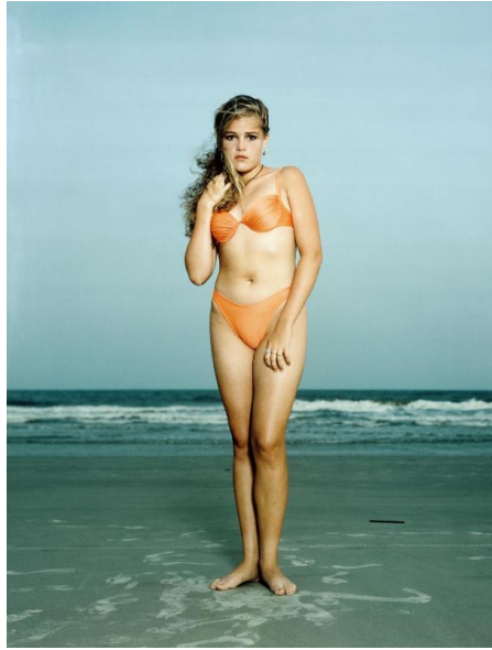
Rineke Dijkstra, Hilton Head Island, S.C., USA, June 24, 1992 , 1992, épreuve à destruction de colorants, 140 x 105 cm, Musée national d'art moderne

Toutefois, le travail des artistes, plus jeunes que les photographes citées précédemment, fait aussi référence à une pratique plus amateur de la photographie à l'ère des selfies sur les réseaux sociaux . Avoir choisi de se représenter en adolescent.e.s ou jeunes adultes questionne la manière dont la jeunesse des années 2010 construit une image d'elle-même dans un contexte d'omniprésence de l'image de soi et des autres.