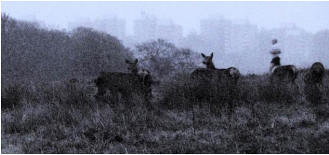
Capture vidéo ENTRE CHIEN ET LOUP / musique de Luc Kheradmand / 2015 / HD / couleur / 5'44"

Elle a ainsi filmé des chutes d'eau, transformant leur mouvement vertical en une image hypnotique. Son intérêt reste vivace également pour la question de la perte des repères – elle a de cette manière suivi des chiens blancs, devenant de simples lueurs dans l'obscurité naissante du soir. Dans les deux cas, l'artiste, qui crée toujours à partir d'une vision où une image fugitive, nous pousse à imaginer des mondes cachés – car « l'obscurité permet de mieux voir » 1 .