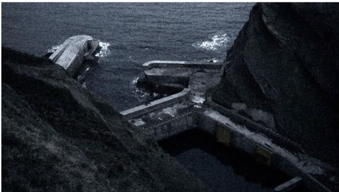
Capture vidéo Ronde de nuit / collaboration avec Marie Sommer / musique de Luc Kheradmand / 2016 / HD / couleur / 5'17"

Ces images sont saisies dans les intervalles où le temps paraît suspendu, où tout peut se produire. Anne-Charlotte Finel cherche à s'éloigner d'une réalité qui serait trop crue, trop définie. Ses vidéos donnent à voir des images lentes, quasi oniriques, semblables à un motif abstrait.