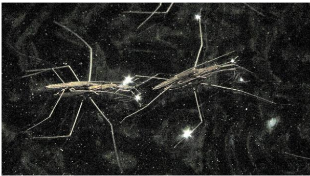
Capture video, Gerridae , 2020, vidéo HD couleur, musique de Voiski, 4'11", © Anne-Charlotte Finel

Anne-charlotte Finel mène aussi une réflexion sur les bêtes mal aimées comme les araignées d'eau ( Gerridae , 2020) ou les serpents. Elle a travaillé ces dernières années sur la question des extrêmes allant du très grand paysage à des échelles bien plus microscopiques. Elle revient toujours à la question de l'animal ainsi depuis 2015 avec Chien et loup ou Molosse en 2016.