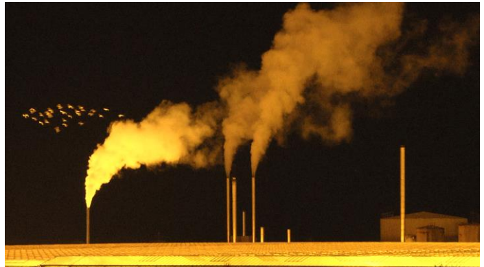
Capture vidéo, Hors-sol , 2020, vidéo HD, musique de Voiski, 10'23', © Anne-Charlotte Finel