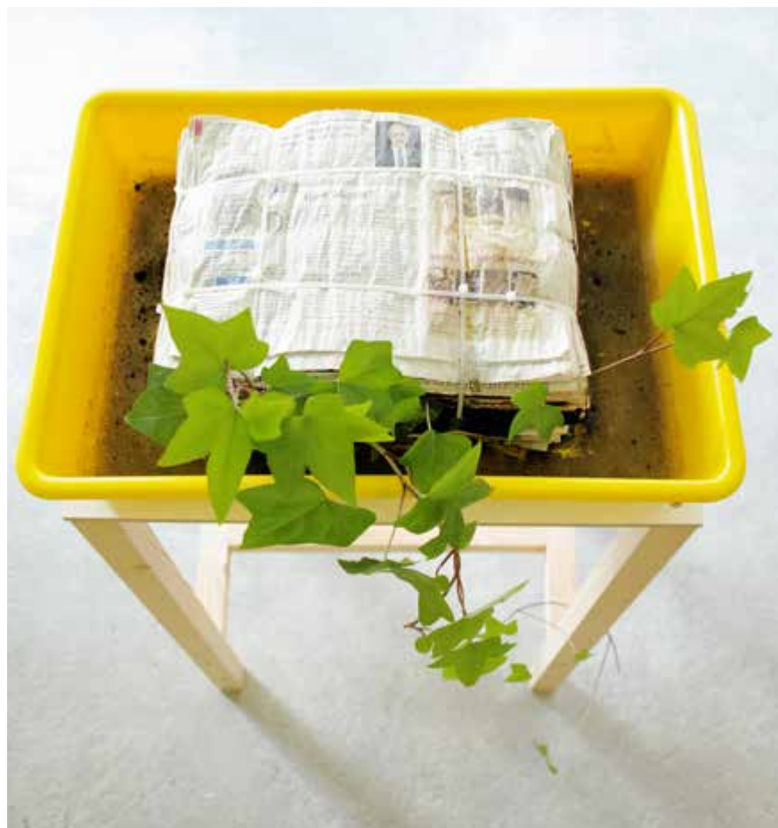
Garden , Lois Weinberger, 2015. Journaux, plante rudérale, bac en plastique, socle en bois, 51 x 36 x 87,5 cm, Édition 2/10 + 2 EA

Cette plante rudérale, souvent considérée indésirable par l'être humain qui souhaite dompter la nature, semble chercher sa place au milieu de la société, symbolisée par les journaux. La présence de la plante intègre la dimension imprévisible, incontrôlable et obstiné du vivant. Le bac en plastique jaune peut rappeler autant ceux utilisés pour développer les photos, que ceux des aéroports dans les zones de contrôles dans lesquelles on dépose ses affaires. Comme les journaux, la matière plastique correspond à la trace de l'homme